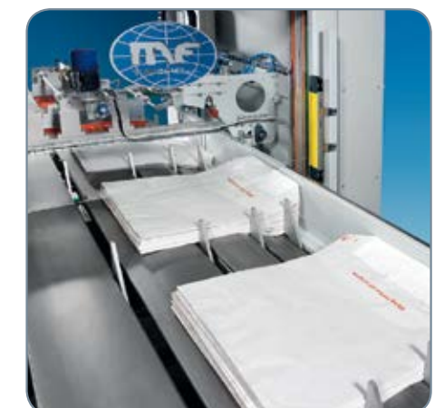
Zásobník prázdnych vriec