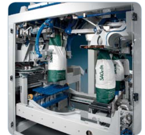
Plniace miesto a uzatváranie vriec