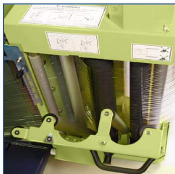
Bezpečné zakládání fólie mezi válce