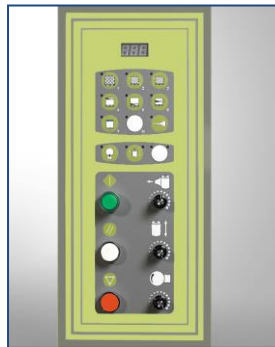
Přehledný ovládací panel